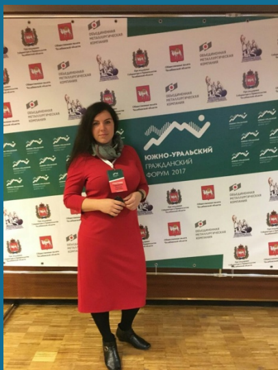
Участники Южно-Уральского гражданского форума