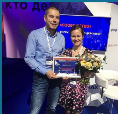
Лауреаты премии «Мой проект – моей стране»