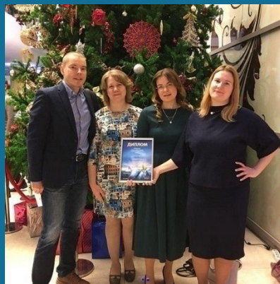
Номинанты в Национальной премии «Гражданская инициатива»